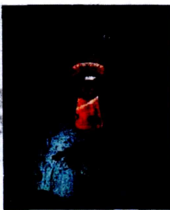
GREEN BOX WWF-HELLAS